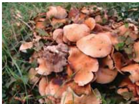
2.5 Agrocybe aegerita , una especie saprófita comestible que crece sobre la cepa de un árbol en Bolonia, Italia. Esta especie también es cultivada.