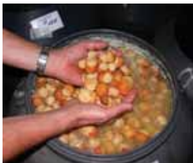
5.12 Especie jóvenes de porcini en salmuera.