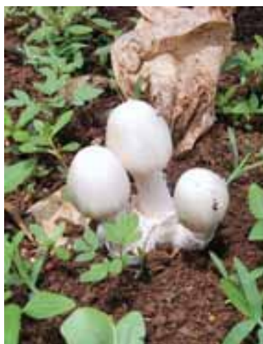
2.6 Volvariella volvacea . Comúnmente cultivado, es un hongo saprófita. Indonesia. Comestible.