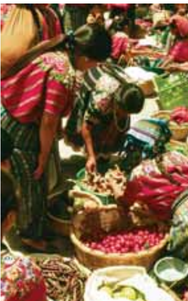
7.3 Mercado de Patzún, Guatemala. Lactarius deliciosus y L. Indigos en venta (en la mano y en el cesto).