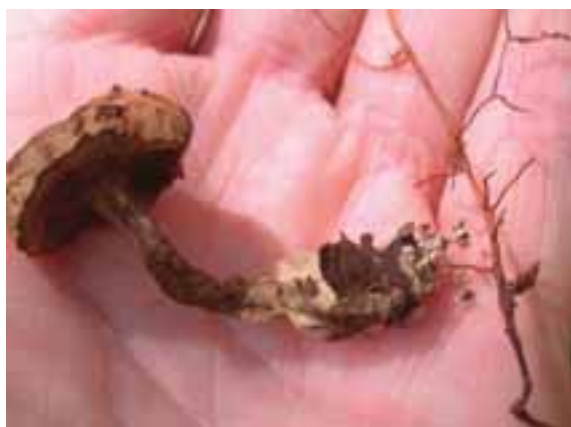
2.4 Al constatar esta conexión física con las raíces de un árbol es posible detallar la simbiosis que existe entre éste y el hongo.