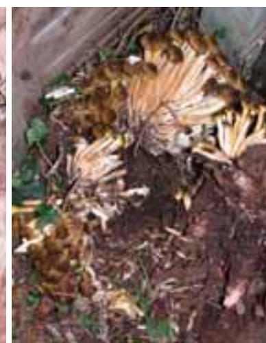
2.8 Armillaria mellea , un árbol patógeno, en la base de un laburno muerto. Londres. Comestible.