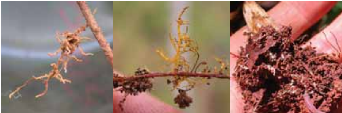
2.1 Ectomicorriza. La materia blanca que envuelve las raíces indica la “vainita” micótica.

Los hongos obtienen su nutrimento simbióticamente, de forma saprófita o parasítica (patógenos). Cada categoría contiene macrohongos comestibles. Las especies más valiosas son ectomicorrízicas: una especie de simbiosis. Las raíces ectomicorrízicas tienen una forma distinta y variada. Es bastante difícil observarlas in situ . Muchos macromicetos saprófitos son comestibles. Pocos patógenos se comen. Todos los ejemplos son de Malawi a menos que se especifique diversamente.