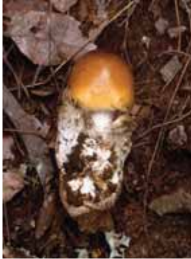
1.2 Amanita loosii , comestible. La volva es una característica particular del Amanita , un género que incluye especies venenosas.