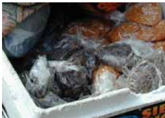
7.7 Los djon djon frescos son cultivados en Haití y exportados a Estados Unidos, Canadá y otros países. Brooklyn, Nueva York.