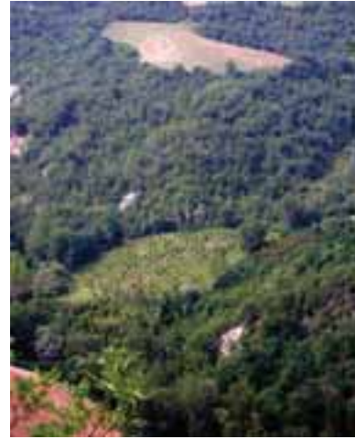
4.3 El claro es una tartufaia ("huerto" de trufas, en italiano) o truffière (en francés). Los árboles son infectados artificialmente con este hongo.