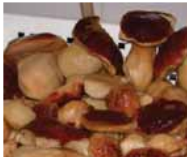
5.3 Porcini cocinados y listos para ser envasados.