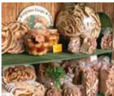
5.6 Porcini secos y en conserva de venta.