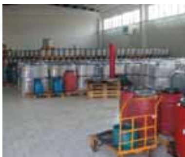
5.9 Porcini y otros hongos en conserva, importados del extranjero.