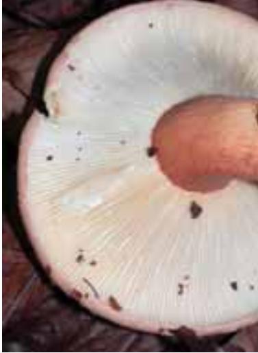
1.1 Sp. Lactarius , tras romper los filamentos se observa un fluido blanco. Muchas especies son comestibles y todas son micorrízicas.

Los hongos comestibles crecen en varias formas y tamaños. No hay elementos característicos (o exámenes) que ayuden distinguirlos de sus variedades venenosas. Los ejemplos son de Malawi y las fotos de Eric Boa, a menos que se especifique diversamente.