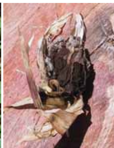
2.7 Mazorca de maíz infectada por el Ustilago maydis , Bolivia. Las infecciones en estadio temprano se comen como huitlacoche en México.