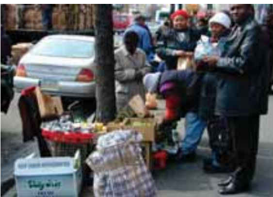
7.6 Las comunidades haitianas en todo el mundo compran a menudo djon djon , especie de la familia Psathyrella , Nueva York.