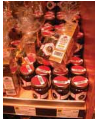
4.9 Tuber magnatum en venta como un alimento exclusivo, cuesta unos 35 $ EE.UU. al tarro.