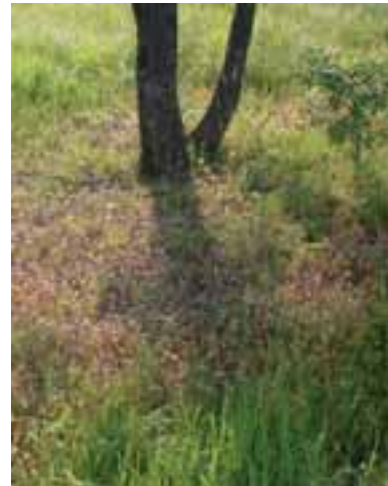
4.6 La vegetación suprimida ( brûlée ) revela la presencia de Tuber aestivum .